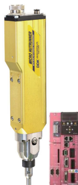
(3)マイクロナットランナー