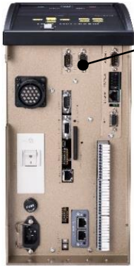
ID データ入力ポート(RS232C)

バーコードリーダー等の RS232C 通信で ID データを入力できます。 入力された ID データ内の機種名から動作パラメーターを指定できます。